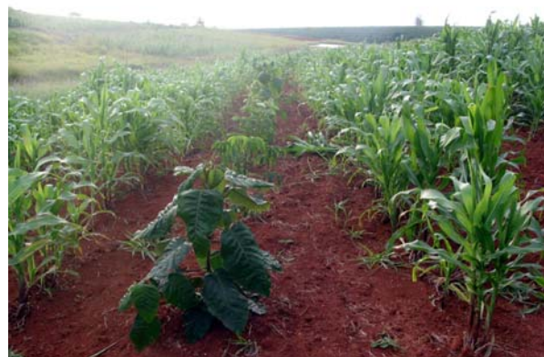
Figura 2 Imagens dos plantios de árvores intercaladas com algumas culturas no restauro de Porto Feliz.