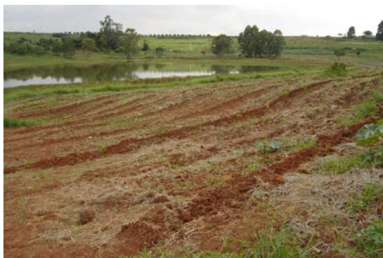
Figura 2 Imagem das áreas de preservação permanente com as mudas plantadas no Assentamento Rural de Porto Feliz, SP.

As áreas já receberam todas as mudas previstas no projeto. No total foram plantadas aproximadamente 13.336 mudas de 80 espécies de árvores, divididas em pioneiras e não pioneiras, de acordo com a Resolução 8 da Secretaria Estadual do Meio Ambiente.