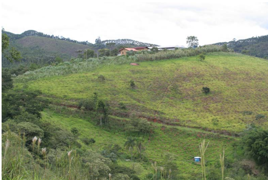
Figura 3 Área sendo preparada para o plantio.