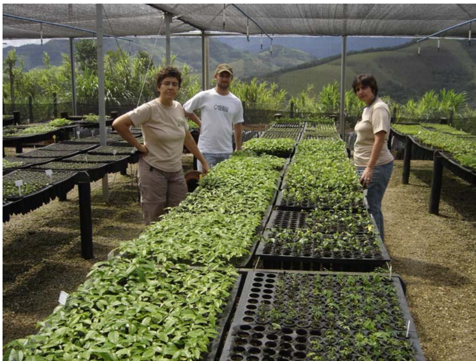
Figura 2 Viveiro de produção de mudas no sítio São Sebastião.

(Figura 2). As mudas foram divididas em pioneiras e não pioneiras, de acordo com a Resolução 8 da Secretaria Estadual do Meio Ambiente (Figura 3 e Figura 4) .