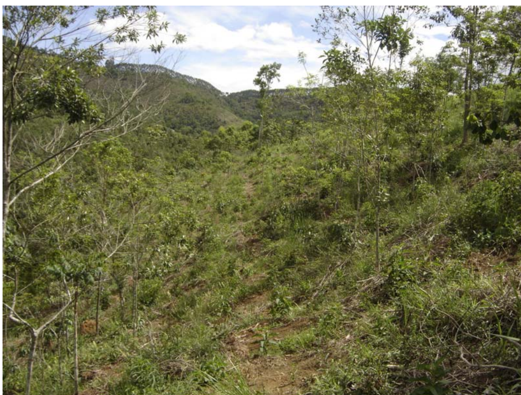
Figura 4 Área com mudas já plantadas.